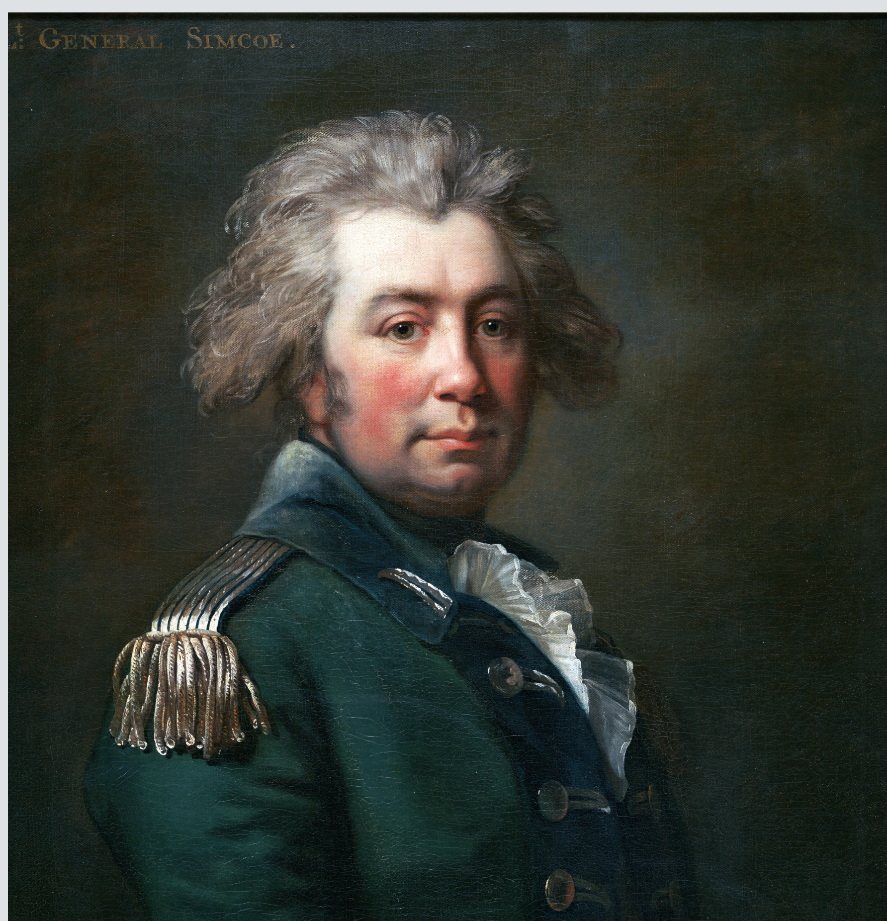
"John Graves Simcoe, 1791" Jean Laurent Mosnier Simcoe is wearing the uniform of the Queen's Rangers. « John Graves Simcoe, 1791 » Jean Laurent Mosnier Simcoe porte l'uniforme des Queen's Rangers.

John Graves Simcoe entered British Parliament in 1790 and was appointed the first Lieutenant Governor of Upper Canada the following year. Commissions issued to John Graves Simcoe and Sir Guy Carleton (Lord Dorchester) on September 12, 1791, established Simcoe as lieutenant governor of Upper Canada and gave Lord Dorchester authority over both Upper and Lower Canada as governor-in-chief.