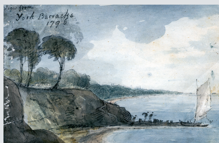
"View From York Barracks" [1796] by Elizabeth Simcoe Watercolour sketch. « Vue depuis la caserne de York » [1796] (traduction libre), par Elizabeth Simcoe. Esquisse à l'aquarelle.

En septembre 1791, John Graves Simcoe quitte la Grande-Bretagne par bateau avec sa femme Elizabeth Posthuma Gwillim Simcoe et leurs deux plus jeunes enfants. La famille arrive à Québec le 11 novembre 1791 et y passe l'hiver avant de s'installer à Kingston, puis à Newark, au printemps suivant.