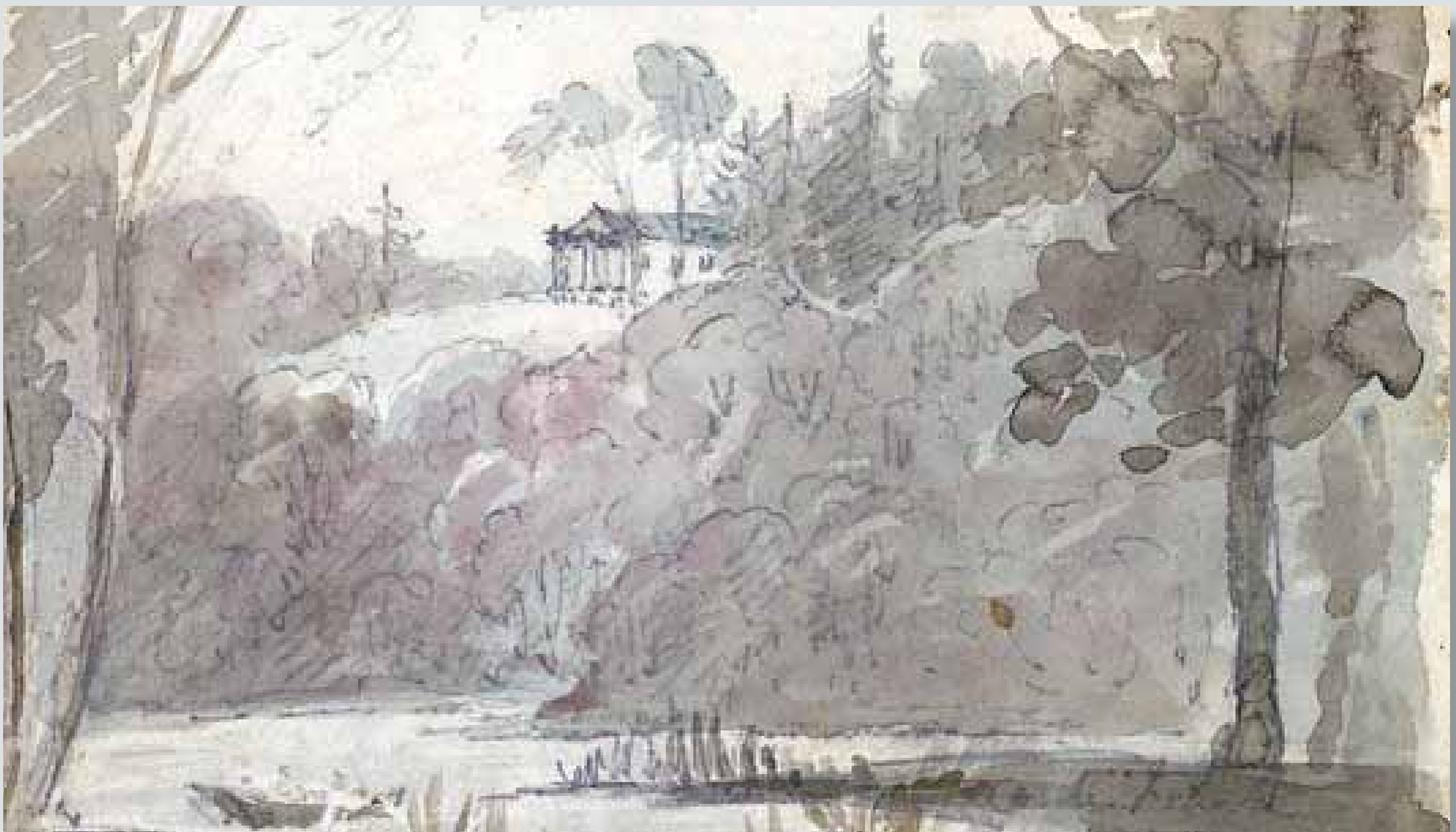
"Castle Frank, near York" [ca.1796] by Elizabeth Simcoe.