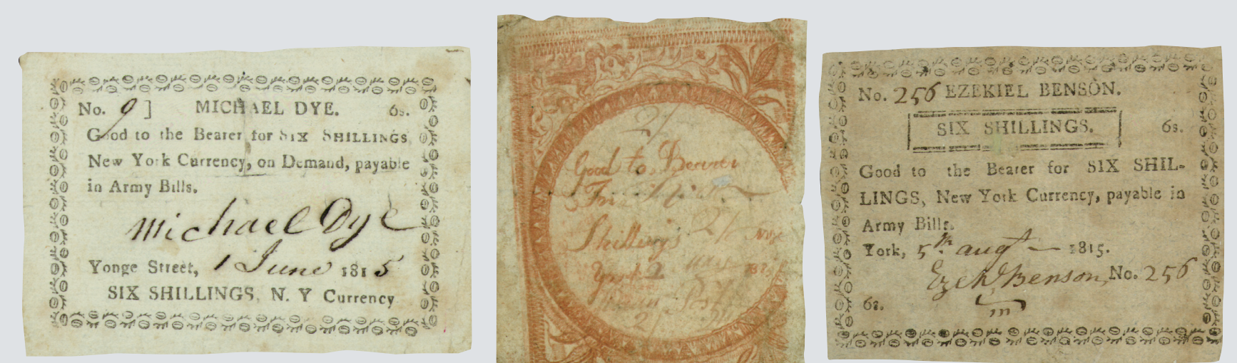
Three small paper currency bills from York, 1815 Trois petits billets (« papier-monnaie ») utilisés à York, 1815