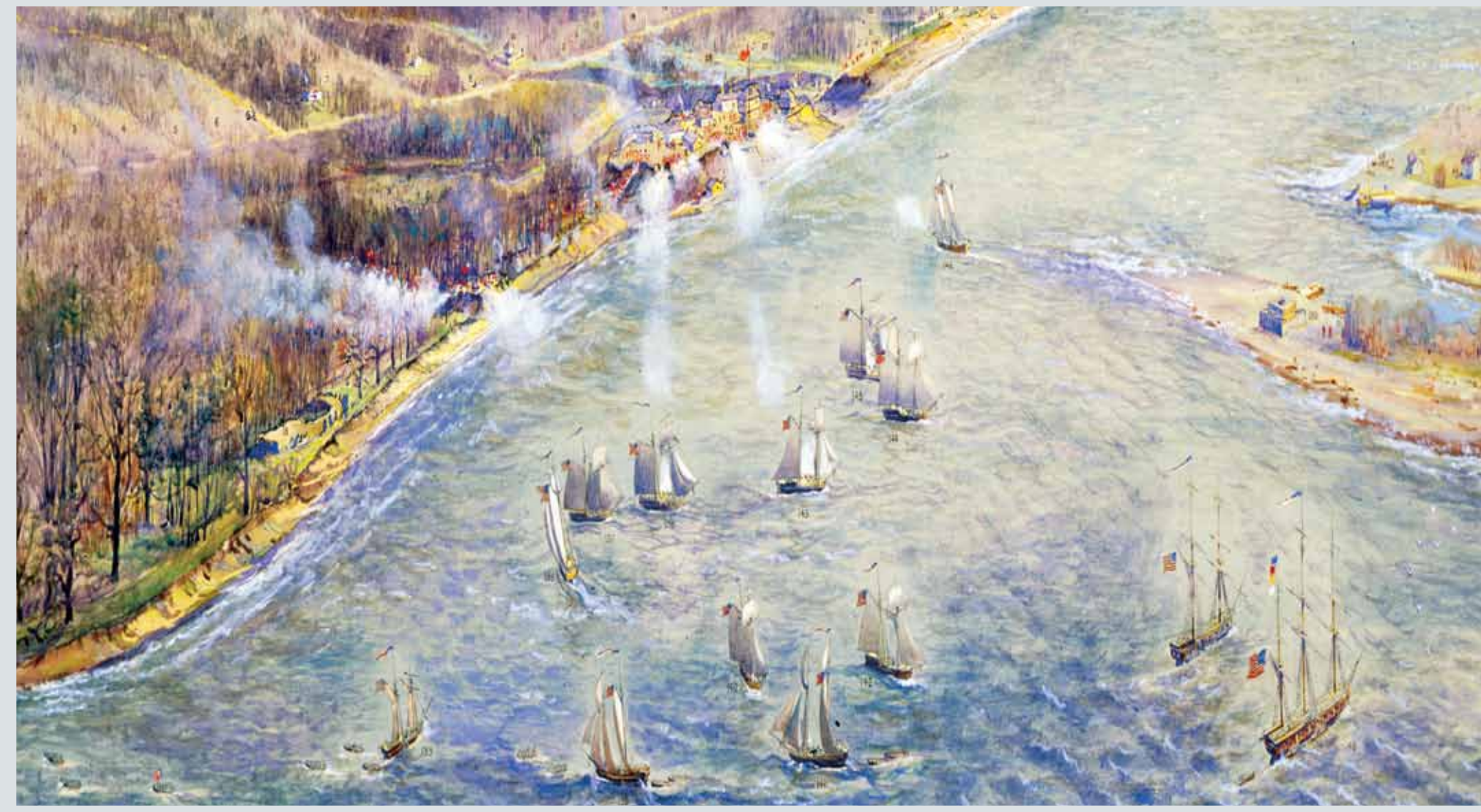
“American fleet attack on York” April 27, 1813 by Owen Staples. Watercolour. Toronto Public Library. TRL:JRR905 « La flotte américaine attaque York » (traduction libre), le 27 avril 1813 par Owen Staples. Aquarelle. Toronto Public Library (TRL):JRR905

On April 27, 1813, the British troops consisted of two companies of the 8th Regiment of Foot, members of the Glengarry Fencibles and the Royal Newfoundland Regiment, 13 men of the Royal Artillery, a small squad of the 49th regiment of Foot and 40 or 50 Mississauga and Ojibway warriors, plus 350 local militia men – totalling just over 700 men. The Americans landed with 1,700 soldiers.