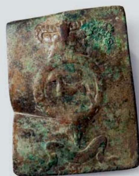
Photograph of 8th (King's) Regiment, British Army, Crossbelt Plate. Rectangular stamped brass plate, bearing the crest of the regiment (running horse encircled with Order of the Garter surmounted by a crown and supported by banner). Discovered during archeological monitoring at Fort York. 5.2 x 7.3cm (Crossbelt Plate Acc. No. 11FY10A2.54) Photographie d'une plaque de baudrier du 8 e régiment (du Roi), armée britannique. Plaque rectangulaire estampillée en laiton portant les armoiries du régiment (un cheval au galop entouré par l'Ordre de la Jarretière, surmonté d'une couronne, avec une bannière dans la partie inférieure). Elle a été découverte lors des inspections archéologiques réalisées à Fort York. 5,2 x 7,3 cm (N o d'acc. de la plaque de baudrier : 11FY10A2.54)

The church and library were looted, the presses of the town's newspaper, The York Gazette, were destroyed and the town's jail prisoners were released to partake in the plunder. Government House, the official residence of the Lieutenant Governor, located just west of Fort York was also torched. The parliament buildings located on this site were broken into and the speaker's mace and a carved lion that sat in front of the speaker's chair were taken as war trophies. The barracks and military storehouses at Fort York were burned and, the Royal standard (flag) was taken as war booty. On the third night of the occupation, the two houses of Parliament were burned almost to the ground.