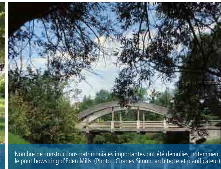
Nombre de constructions patrimoniales importantes ont été démolies, notamment le pont bowstring d'Eden Mills. (Photo : Charles Simon, architecte et planificateur)

culte et de résidences historiques ont ainsi été réparés, remis à neuf, restaurés, adaptés et protégés, notamment le Mackenzie Hall de Sandwich, les Ruines de St. Raphael, le Temple de Sharon, l'ancienne gare ferroviaire du Grand Tronc de Port Hope, la station de pompage de Hamilton et le pavillon d'information touristique de Thunder Bay, pour n'en citer que quelques exemples.