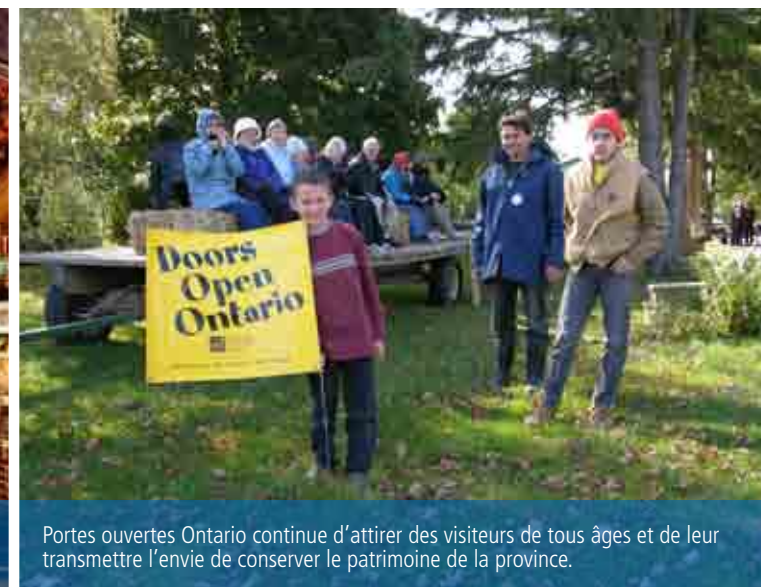
Portes ouvertes Ontario continue d'attirer des visiteurs de tous âges et de leur transmettre l'envie de conserver le patrimoine de la province.