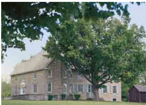
Participez aux activités divertissantes organisées au musée Homewood, le 29 juillet!

Voici une liste non exhaustive des événements et activités prévus pour les mois à venir. Rendez-vous sur notre site Web www.heritagetrust.on.ca pour savoir plus!