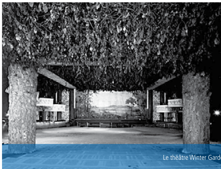
Le théâtre Winter Garden, jadis et de nos jours.

théorique, mais aussi concrètement, à travers des camps et des stages d'été, l'apprentissage des arts de la restauration et des programmes coopératifs aux niveaux secondaire et postsecondaire. Nous devons collaborer plus étroitement avec les métiers spécialisés pour sensibiliser à la conservation patrimoniale et susciter de l'intérêt pour cette branche. Si nous parvenons à transmettre ce sentiment d'importance de notre patrimoine bâti aux écoliers aujourd'hui, ils seront mieux à même de faire des choix en connaissance de cause quand viendra leur tour de prendre des décisions à propos des édifices que nous leur léguerons.