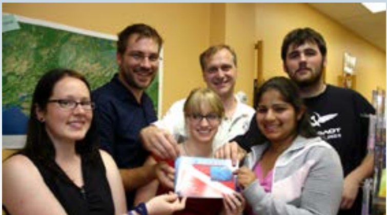
La Great-West Life, la London Life et Canada-Vie soutiennent le programme Jeunes leaders du patrimoine de la Fiducie depuis son lancement en 2000. Ces sociétés ont récemment renouvelé et renforcé leur engagement financier au titre de ce programme, qui prévoit désormais, pour les deux années à venir, un appui à une stratégie visant à intensifier la participation des jeunes. Grâce à ce soutien, la Fiducie sera en mesure d’offrir de nouvelles possibilités éducatives dans les musées, d’élargir ses partenariats avec des organismes axés sur la jeunesse et de renforcer le mentorat des jeunes professionnels du patrimoine.