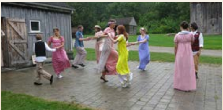
Le musée Homewood, dans l’Est de l’Ontario, a été animé l’été dernier par des manifestations spéciales et des visites guidées inédites. Avec l’aide de trois élèves de la localité employés pendant la saison estivale, le site a organisé en juillet sa journée annuelle de la famille, et, pour la première fois, a fait partie du circuit des visites en autocar de St. Lawrence Cruise Lines. La Fiducie remercie la Fondation Earl B. Connell pour son engagement constant, qui permet d’ouvrir les portes du musée Homewood pour le plus grand plaisir des visiteurs.