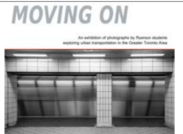
L’exposition En route sera présentée au Centre des salles de théâtre Elgin et Winter Garden jusqu’au 3 avril 2014 par le truchement du projet Artistes émergents RBC