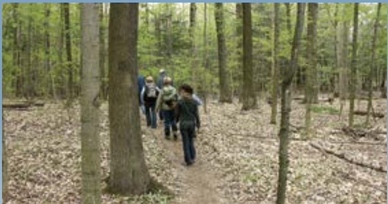
La Fiducie est heureuse d’annoncer un nouveau partenariat avec le Groupe Banque TD. À partir de 2014, le Groupe Banque TD soutiendra le volet Sentiers ouverts Ontario du programme Portes ouvertes Ontario. Depuis sept ans, Sentiers ouverts Ontario promeut l’utilisation et la connaissance des sentiers, appuie la conservation et la gestion du patrimoine naturel et encourage l’activité physique et l’adoption d’un mode de vie sain. Nous nous réjouissons de collaborer cette année avec le Groupe Banque TD à l’occasion de ce nouveau projet exaltant!

. . . Nous remercions également tous les donateurs qui ont souhaité garder l’anonymat.