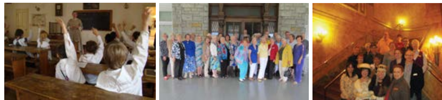
Photos, en partant de la gauche : élèves participant à un programme éducatif à l'école Enoch Turner; membres de l'Association des amis de Fulford Place; bénévoles du Centre des salles de théâtre Elgin et Winter Garden.