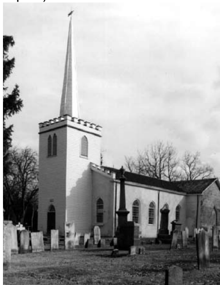
St. Thomas Pioneer Church, St. Thomas