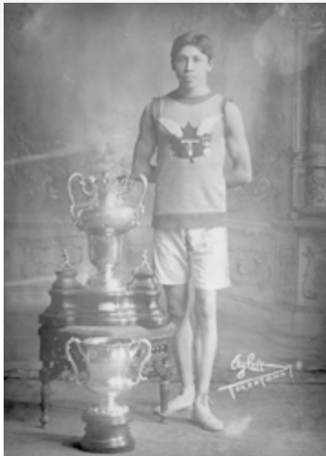
Tom Longboat et ses trophées de course (22 avril 1907).

Si vous souhaitez collaborer avec nous ou soutenir financièrement ces travaux, n'hésitez pas à m'appeler en composant le 416 314-4901. Je me ferai un plaisir de discuter avec vous.