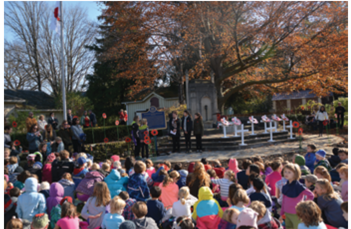
Le 11 novembre, la Fiducie a inauguré la plaque commémorant le lieutenant-colonel John McCrae lors de la cérémonie annuelle du jour du Souvenir organisée par la John McCrae Public School.

Au cours des années marquant le centenaire de la Première Guerre mondiale (1914-1918), la Fiducie consacre une partie de ses programmes à la « Grande Guerre ». Récemment, la Fiducie a commémoré le lieutenant-colonel John McCrae (1872-1918) en installant une plaque provinciale en l'honneur de cet éminent soldat, médecin et poète. L'héritage de John McCrae perdure au travers de son émouvant et éloquent poème, « Au champ d'honneur ».