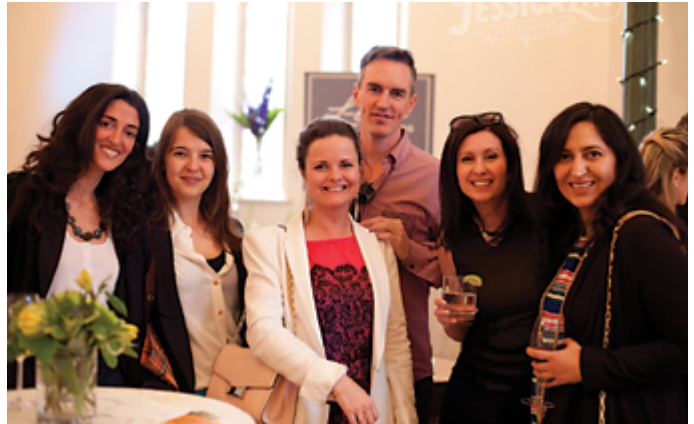
Participants à la « Love(ly) Cocktail Party ».

Si de nombreux couples aiment l'école Enoch Turner, c'est parce que c'est dans ce lieu unique qu'ils se sont mariés, scellant leur amour devant leur famille et leurs amis.