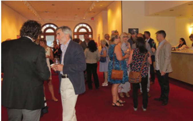
Participants au gala de la soirée d'ouverture du TIFF.

La Fiducie du patrimoine ontarien accueille chaque année la soirée d'ouverture du Festival international du film de Toronto (TIFF) au Centre des salles de théâtre Elgin et Winter Garden. Cette soirée, l'un des prestigieux événements organisés par la Fiducie, allie l'effervescence du festival et l'intimité d'un cocktail entre amis.